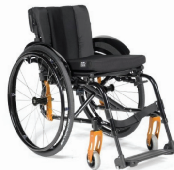
Mechanické vozíky prošly mnoha inovacemi.